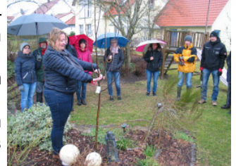
Foto: Die Kreisfachberaterin zeigt den richtigen Schnitt